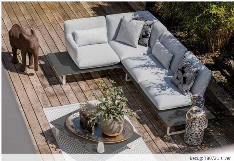
Bezug: T80/21 silver