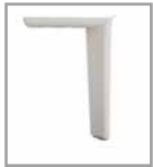
Metallfuß versch. Farben