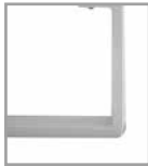
Metallkufe versch. Farben Mehrpreis